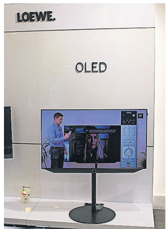
Der LOEWE bild v 48 bietet eine Top-Qualität.

LOEWE-Galerie präsentiert den bild v 48. Service und Aufstell-Lösungen aus einer Hand