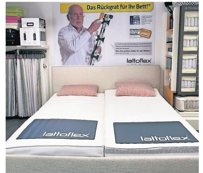
Gesunder Schlaf durch zertifizierte Schlafsysteme.

Zum Angebot gehören viele hochwertige Betten und Bettensysteme wie Lattoflex, Grand Lux by Superba, Tempur, Metzeler oder Superba, die alle zu den Top Ten in Deutschland gehören. Die Produkte der Hersteller Lattoflex und Metzeler sind sogar zertifiziert von der Aktion Gesunder Rücken (AGR), die sich