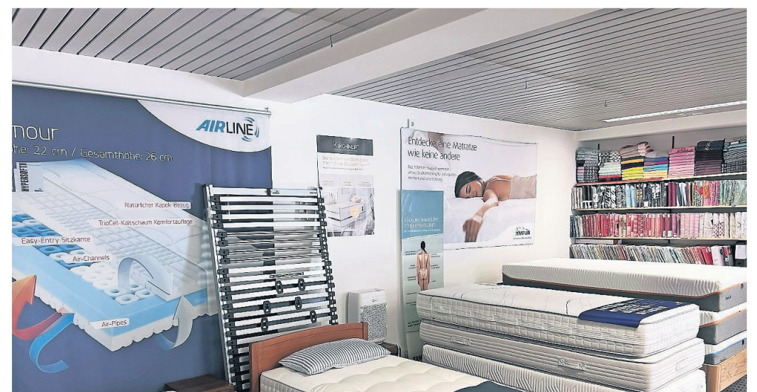
Beim Räumungsverkauf im Bettenhaus Schneider werden hochwertige Schlafsysteme und deren Bestandteile besonders günstig angeboten.

Bettenhaus Schneider Haydnstraße 55 53115 Bonn Tel. 0228/635885 info@bettenhaus-schneider.de bettenhaus-schneider.de