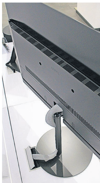
Zum Service-Angebot gehört auch die fachgerechte Verkabelung der Geräte.